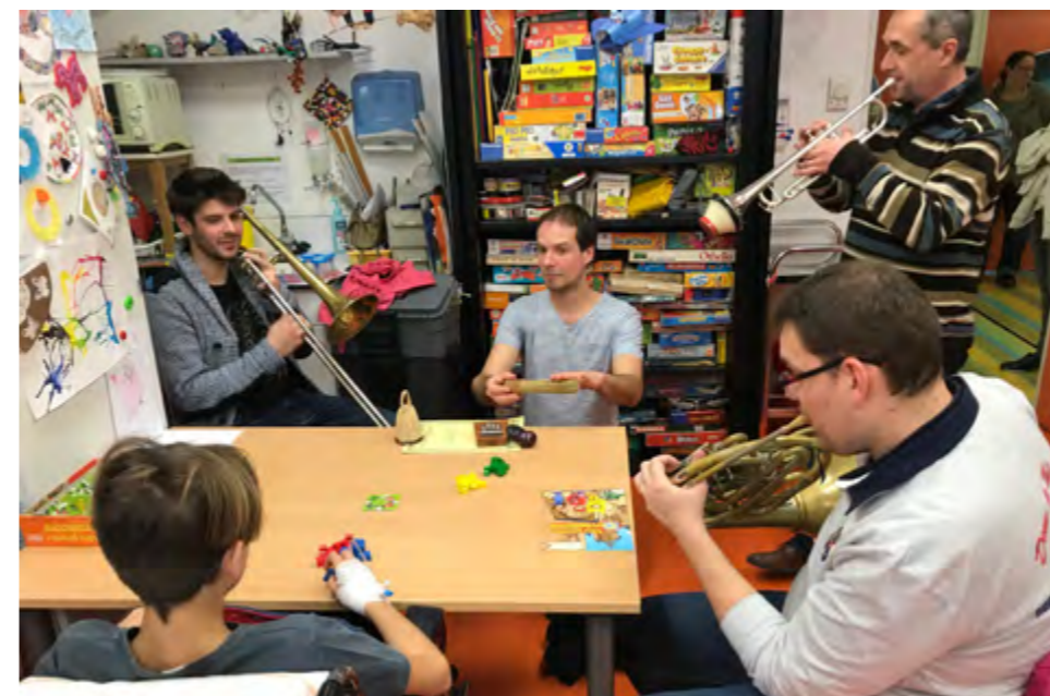
Les musiciens de l'ONL à l'hôpital P. Wertheimer en 2018.