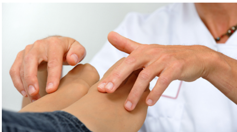
© Véronique Védrenne, Prise en charge de la douleur par les techniques complémentaires