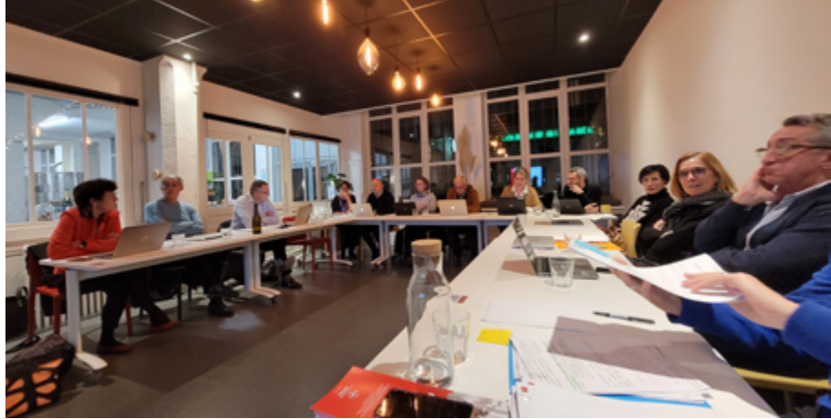
Réunion du conseil scientifique en décembre 2022