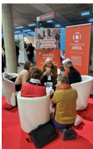
Stand de la Fondation au congrès de la SFETD 2022