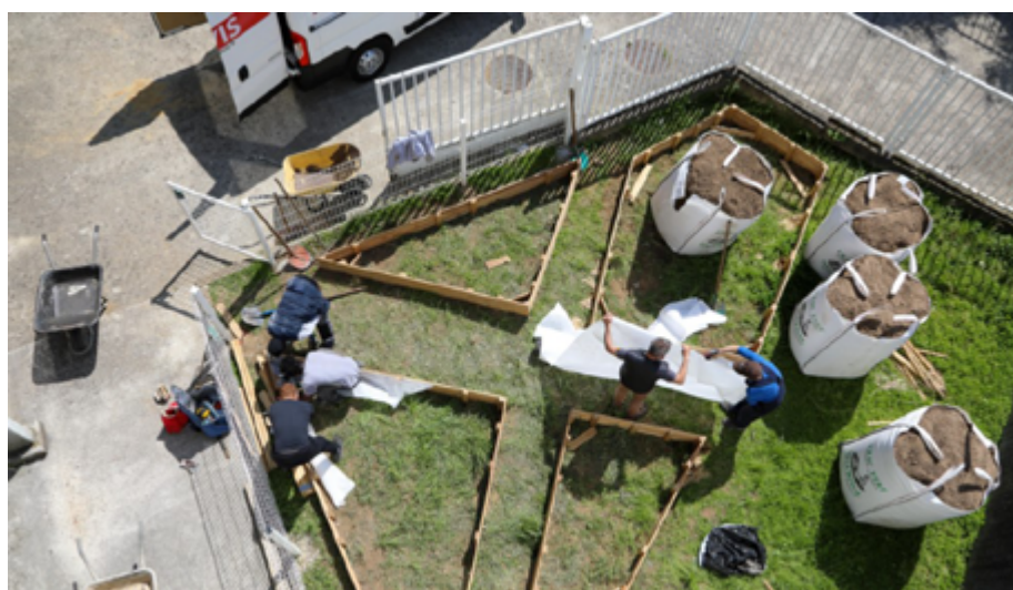
Jardin thérapeutique à l'hôpital

En 2022, 2 nouveaux prix de recherche ont également été financés en partenariat avec la SFAR et la SFETD (Société française d'Anesthésie et de réanimation et Société Française d'Etude et de Traitement de la Douleur).